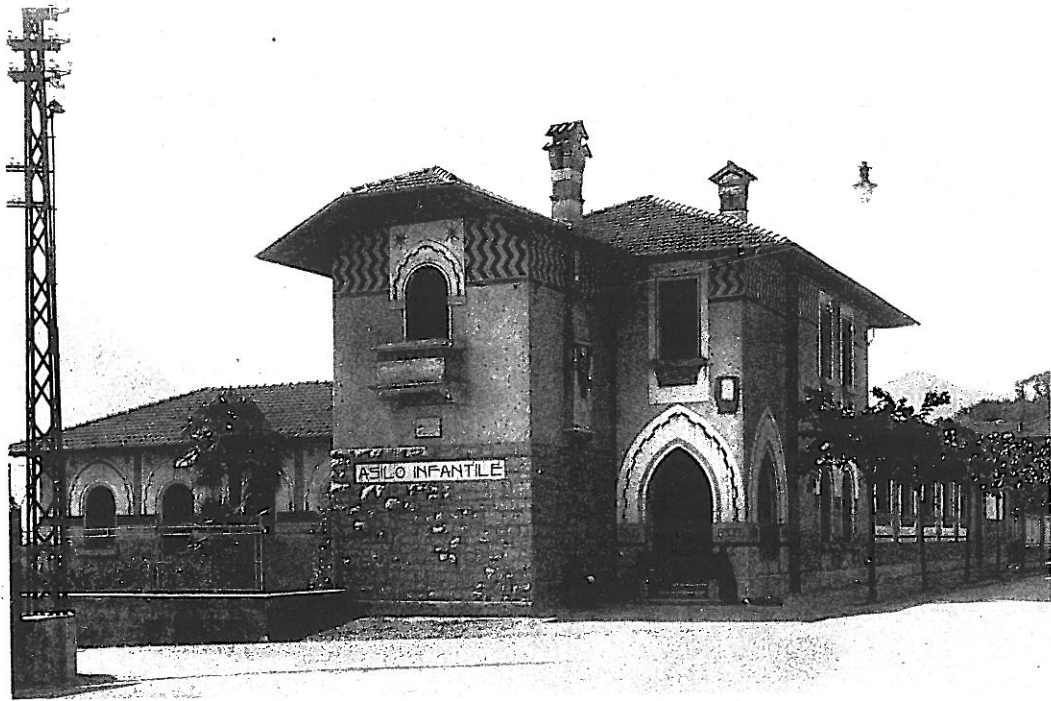
LOVERE - Asilo Infantile