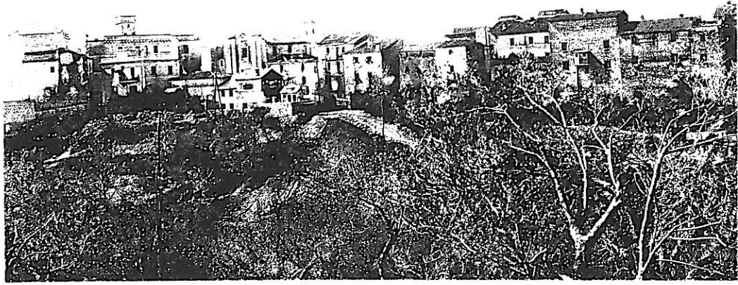
Caserta - Panorama