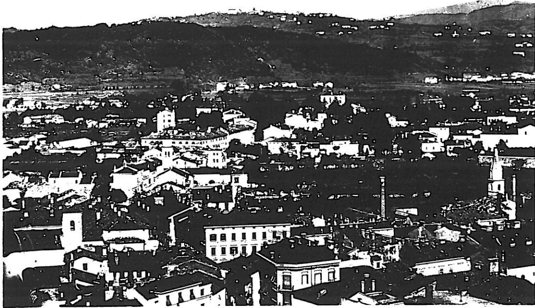
4297 - GORIZIA - Panorama